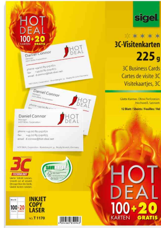
Visitenkarten 3C "HOT DEAL"