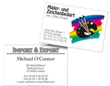
Visitenkarten 3C, Anwendungsbeispiel