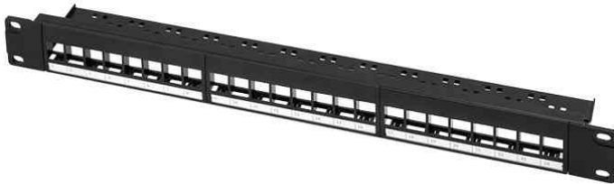
19" Keystone Patch Panel, 24 Port, unbestückt