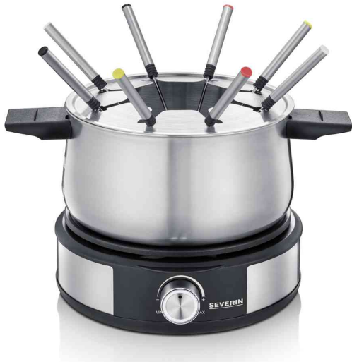
Fondue-Crêpes-Kombination FO 2471