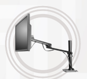
Höhenverstellbarer Arm von Lenovo