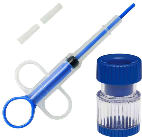
Distributeur de comprimés / d'aliments + broyeur à comprimés