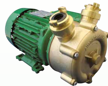
EP Bronze mit GEKA-Kupplung*