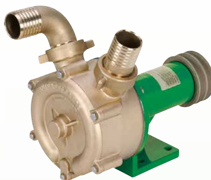
EP für Keilriemenantrieb mit Lagerfuß*