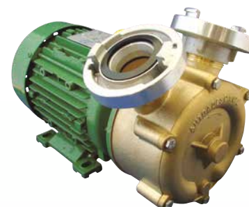
EP Bronze mit C-Kupplung*