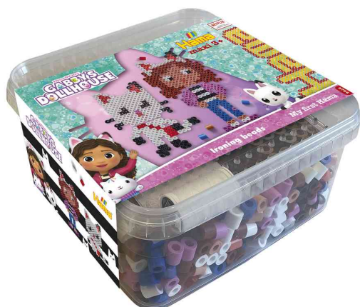
Perles à repasser midi "Gabbys Dollhouse", dans une boîte

ATTENTION ! ne convient pas aux enfants de moins de 36 mois, en raison de petites pièces pouvant être avalées