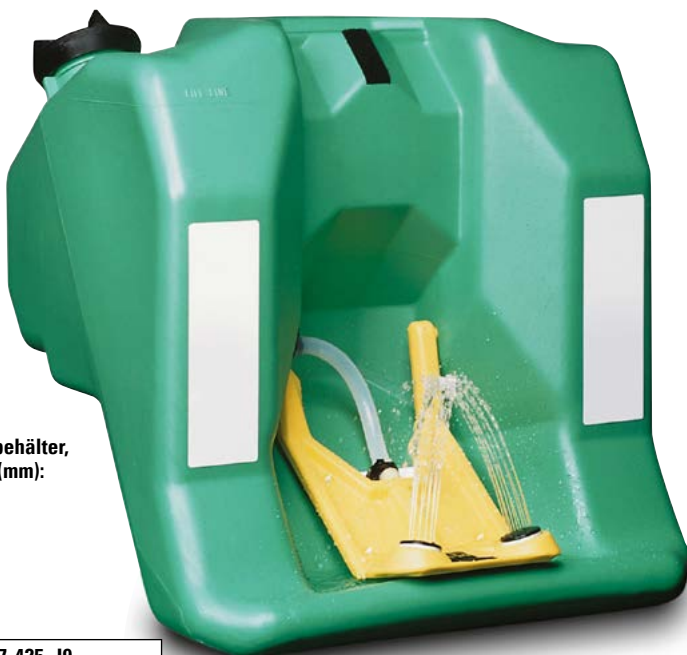
60 Liter Wasserbehälter, Maße B x T x H (mm): 500 x 310 x 665