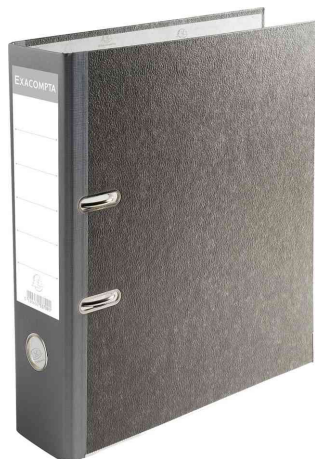
Visuel de référence: Classeur à levier standard papier marbré

Référence: 8700470: avec mini perforateur intégré dans la 2ème de couverture