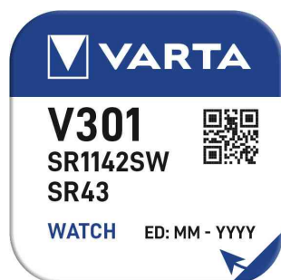
Visuel de référence : pile bouton SILVER - blister à godet