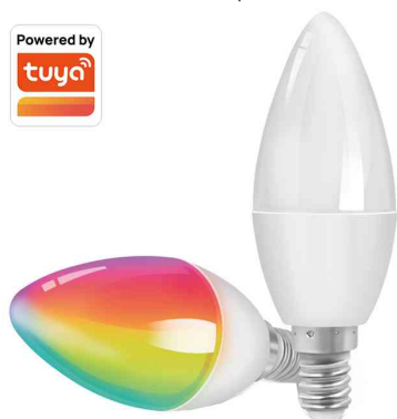
Ampoule LED WiFi Smart, culot : E14