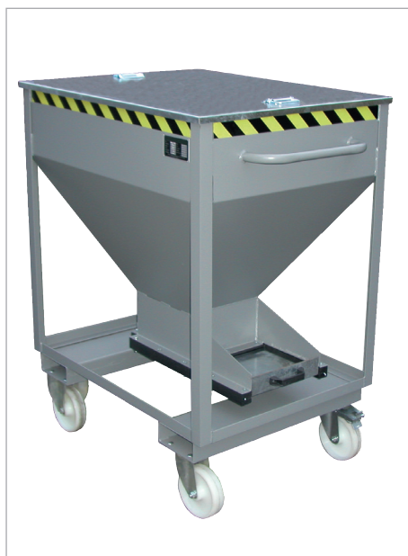
SRE-D mit Deckel