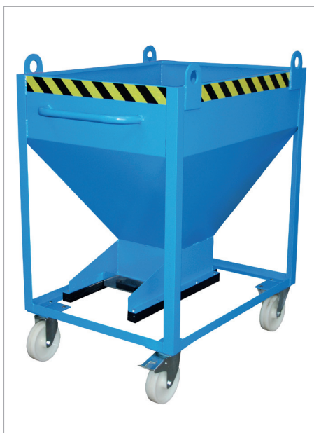
SR-D mit Kranösen