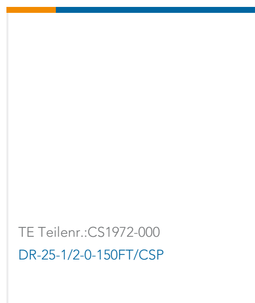
TE Teilnr.: CS1972-000 DR-25-1/2-0-150FT/CSP