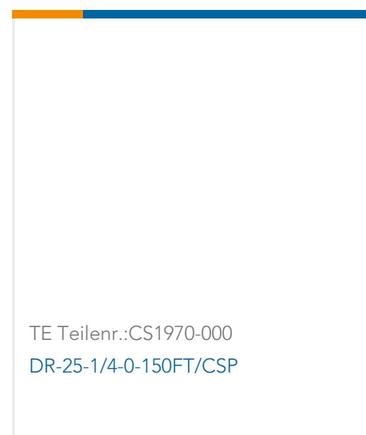
TE Teilnr.: CS1970-000 DR-25-1/4-0-150FT/CSP