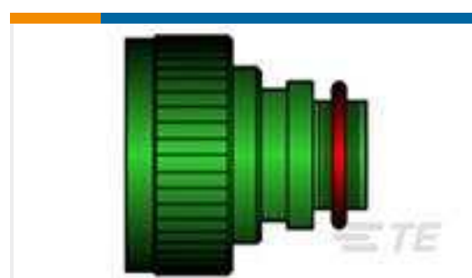
TE Teilnr.: A90180-000 TXR66AB00-2414AI