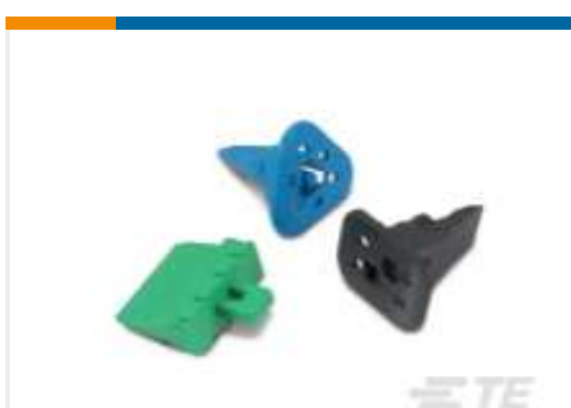
TE Teilnr.:W2S DEUTSCH DT Keilschlösser