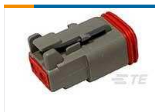
TE Teilnr.:DT06-2S PLG, 2P, GRY, N