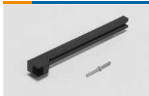
Hardware für Stiftwannen- und Buchsenführungen(1)