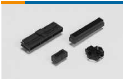
Anschlusswannen für Leiterplatten-Steckverbinder(2)