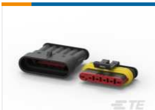
TE Teilnr.:282104-1 AMP SUPERSEAL 1.5MM, STECKVERBINDERGEHÄUSE