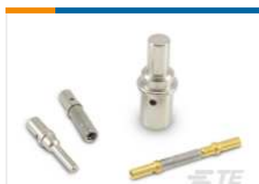
TE Teilnr.:0460-202-16141 DEUTSCH Kontakte