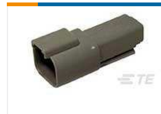
TE Teilnr.:DT04-2P REC, 2P, GRY, N