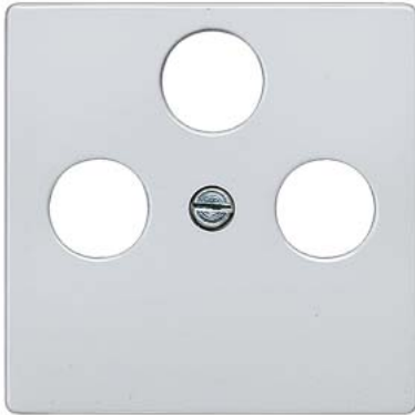
DELTA i-system aluminiummetallic Abdeckplatte TV/RF/SAT, 3-Loch 55x55mm