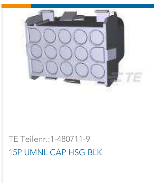
TE Teilnr.:1-480711-9 15P UMNL CAP HSG BLK