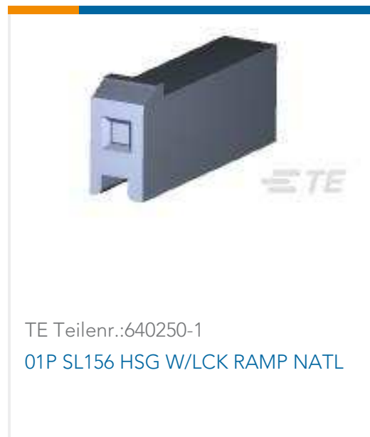
TE Teilnr.:640250-1 01P SL156 HSG W/LCK RAMP NATL