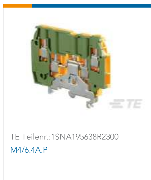
TE Teilnr.:1SNA195638R2300 M4/6.4A.P