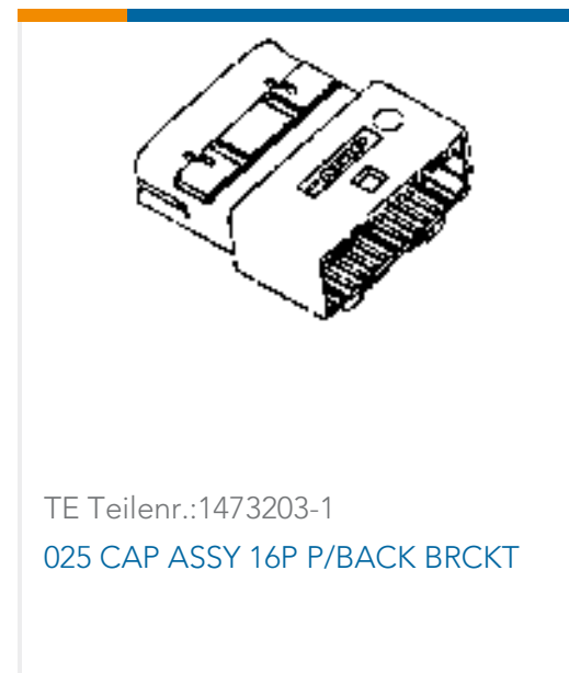
TE Teilnr.:1473203-1 025 CAP ASSY 16P P/BACK BRCKT