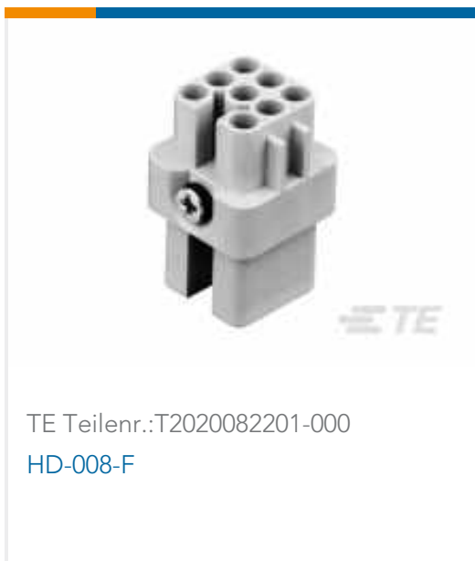
TE Teilnr.:T2020082201-000 HD-008-F