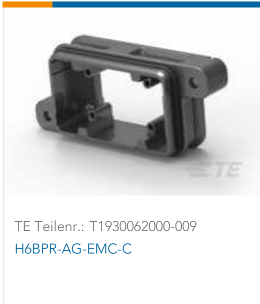
TE Teilnr.: T1930062000-009 H6BPR-AG-EMC-C