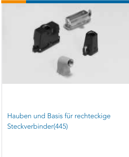
Hauben und Basis für rechteckige Steckverbinder(445)