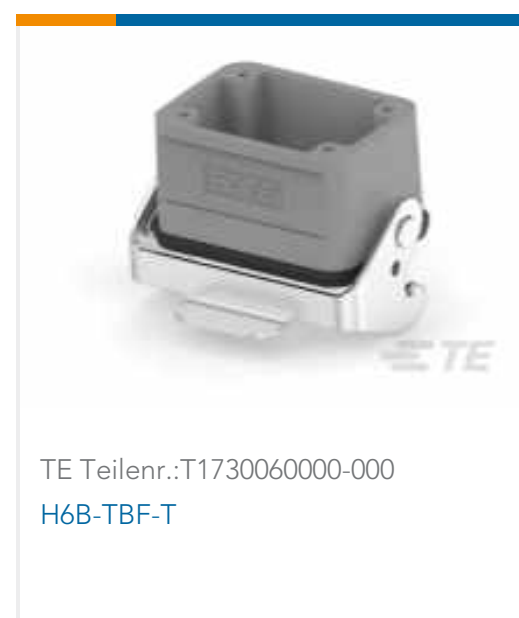
TE Teilnr.:T1730060000-000 H6B-TBF-T