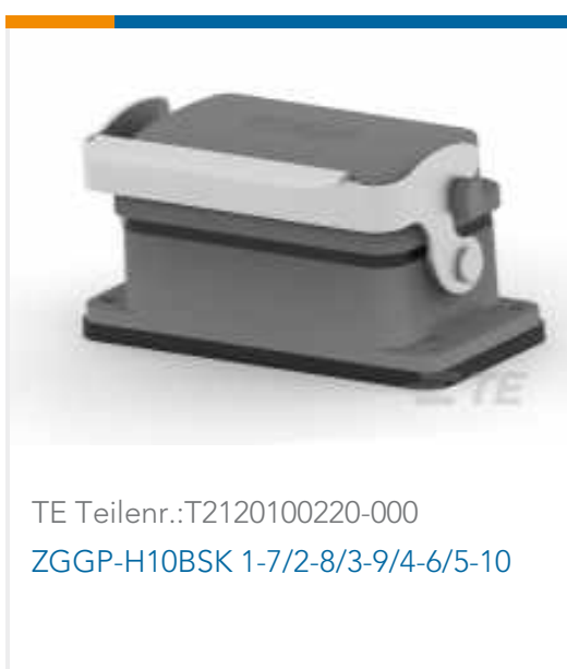
TE Teilnr.:T2120100220-000 ZGGP-H10BSK 1-7/2-8/3-9/4-6/5-10