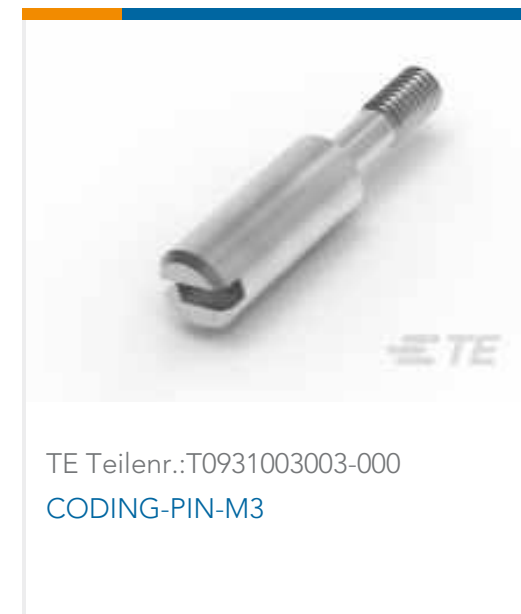
TE Teilnr.:T0931003003-000 CODING-PIN-M3