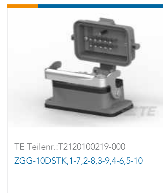
TE Teilnr.:T2120100219-000 ZGG-10DSTK,1-7,2-8,3-9,4-6,5-10