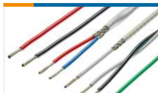
TE Teilnr.:CQ46883001 44/7031-20-9CK0001