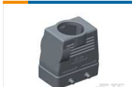
TE Teilnr.:T1240100129-000 H10B-TGH-PG29