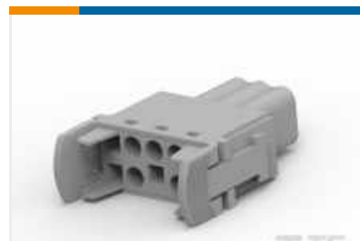
TE Teilnr.:T2110052201-000 HMN-005-FS