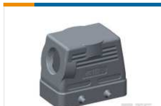
TE Teilnr.:T1210100120-000 H10B-TS-M20