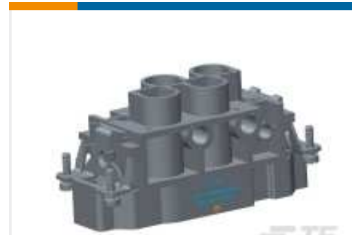
TE Teilnr.:T2100042101-000 HK4/0-004-M,WITH ONE SLOT SCREW