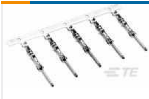
TE Teilnr.:1-66098-8 III+ PIN,18-16,TIN STRIP