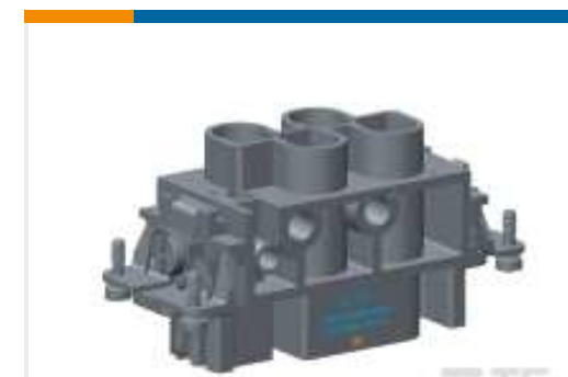
TE Teilnr.:T2100042201-000 HK4/0-004-F,WITH ONE SLOT SCREW