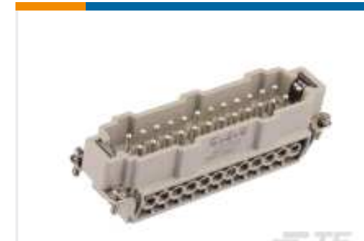
TE Teilnr.:T2040242101-000 HE-024-M