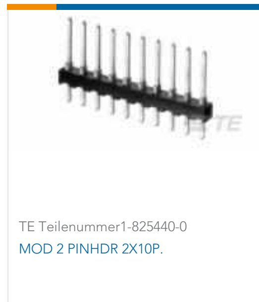
TE Teilenummer 1-825440-0 MOD 2 PINHDR 2X10P.