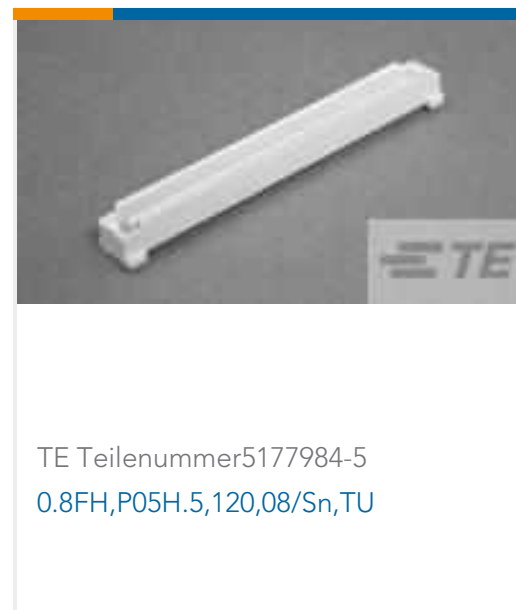
TE Teilenummer 5177984-5 0.8FH, P05H.5, 120, 08/Sn, TU