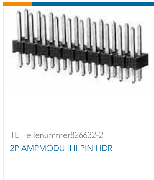
TE Teilenummer 826632-2 2P AMPMODU II II PIN HDR