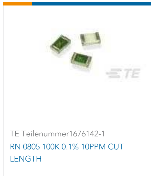
TE Teilenummer 1676142-1 RN 0805 100K 0.1% 10PPM CUT LENGTH