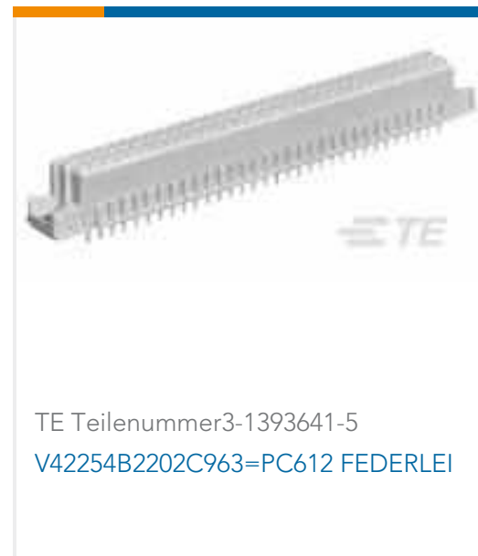
TE Teilenummer 3-1393641-5 V42254B2202C963=PC612 FEDERLEI