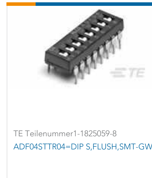
TE Teilenummer 1-1825059-8 ADF04STTR04=DIP S, FLUSH, SMT-GW