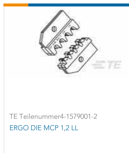
TE Teilenummer 4-1579001-2 ERGO DIE MCP 1,2 LL