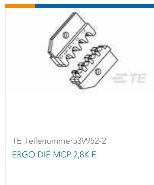
TE Teilenummer 539952-2 ERGO DIE MCP 2,8K E