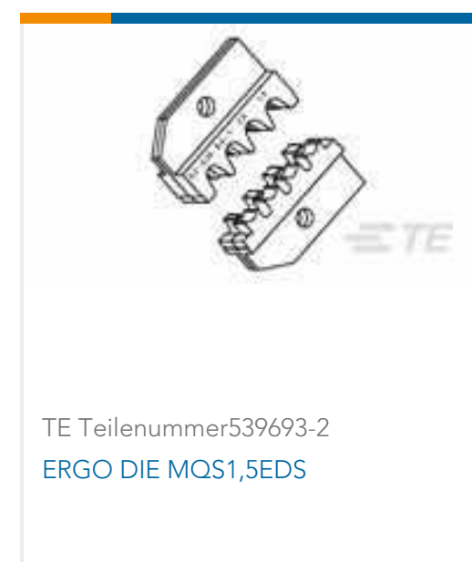
TE Teilenummer 539693-2 ERGO DIE MQS1,5EDS