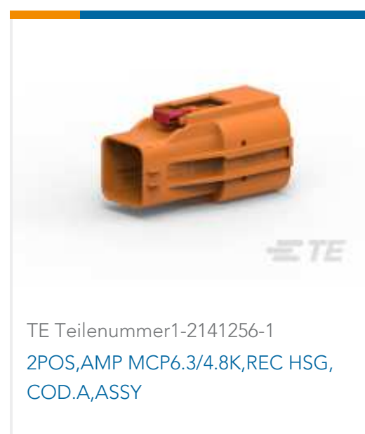
TE Teilenummer 1-2141256-1 2POS,AMP MCP6.3/4.8K,REC HSG, COD.A,ASSY