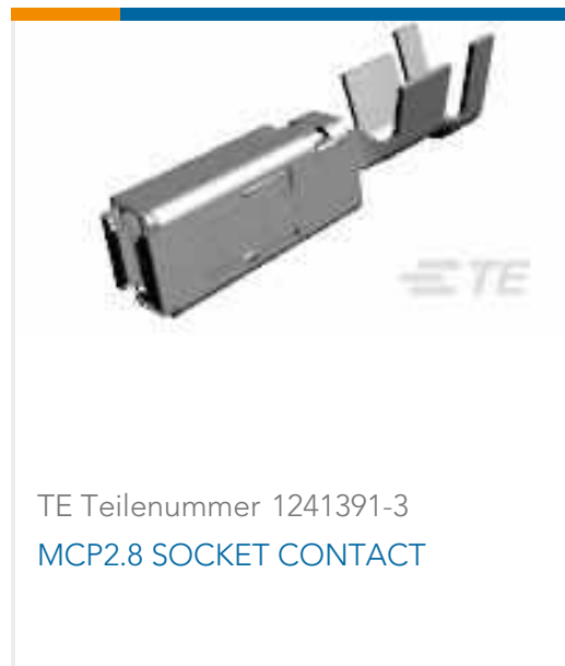
TE Teilenummer 1241391-3 MCP2.8 SOCKET CONTACT