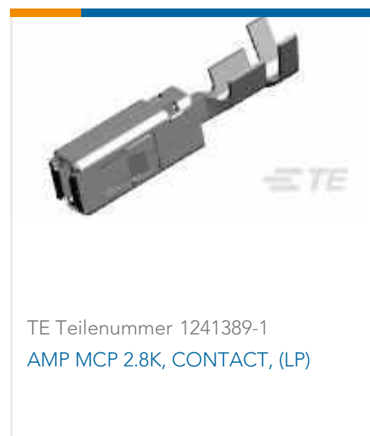
TE Teilenummer 1241389-1 AMP MCP 2.8K, CONTACT, (LP)