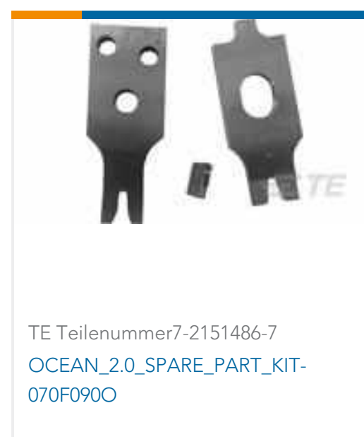
TE Teilenummer 7-2151486-7 OCEAN_2.0_SPARE_PART_KIT-070F0900