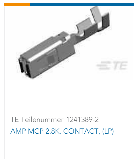
TE Teilenummer 1241389-2 AMP MCP 2.8K, CONTACT, (LP)