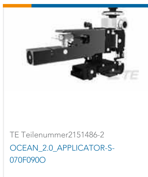
TE Teilenummer 2151486-2 OCEAN_2.0_APPLICATOR-S-070F0900