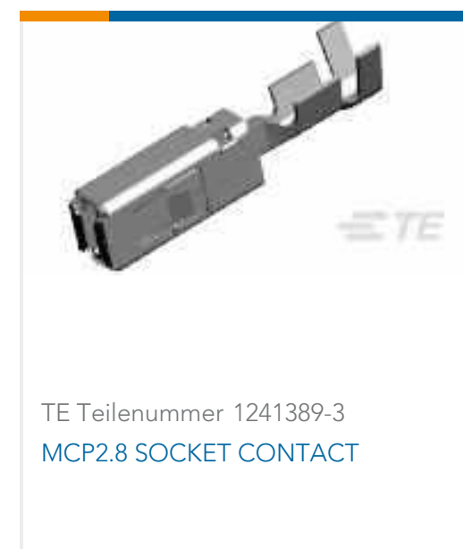
TE Teilenummer 1241389-3 MCP2.8 SOCKET CONTACT