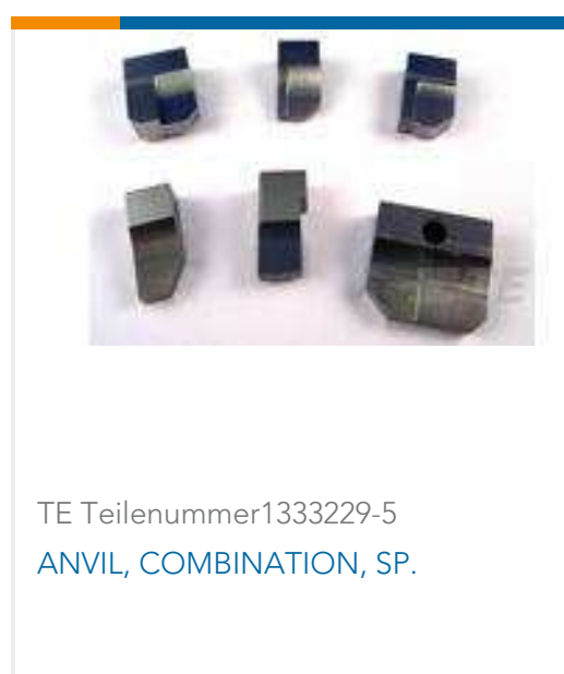
TE Teilenummer 1333229-5 ANVIL, COMBINATION, SP.