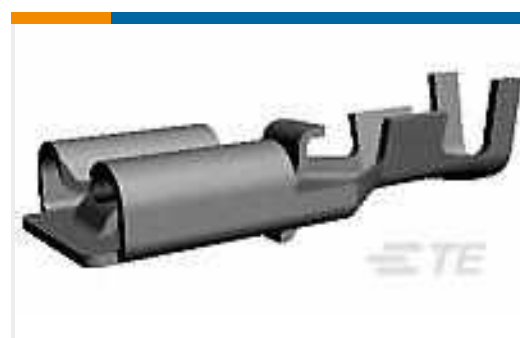
TE Teilenummer179973-6 PL EX 250 REC 22-18 PTPCOPPER-ALLOY