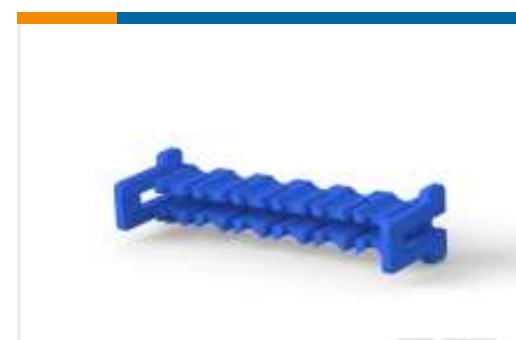
TE Teilenummer2-1971904-6 TPA 12POS,NEW GIC3.3