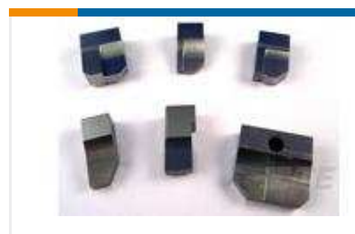
TE Teilenummer2-1633928-1 ANVIL COMBINATION