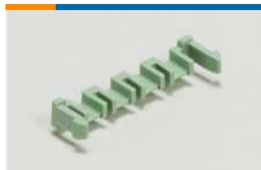
Laschen, Verriegelungen und Arretierungen für Leiterplatten(6)