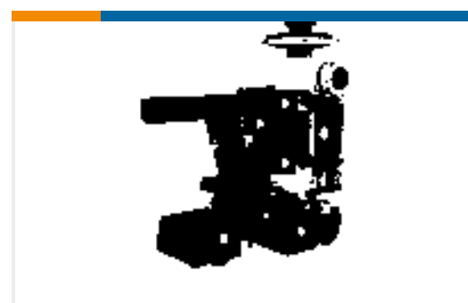
TE Teilenummer2151949-1 OCEAN-2.0-APPLICATOR-S-050F102F