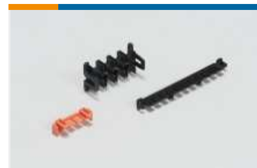
Verriegelung von rechteckigen Steckverbindern(7)