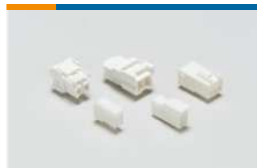
Rechteckige Leistungssteckverbinder (61)