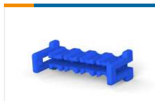
TE Teilenummer2-1971904-4 TPA 8POS,NEW GIC3.3