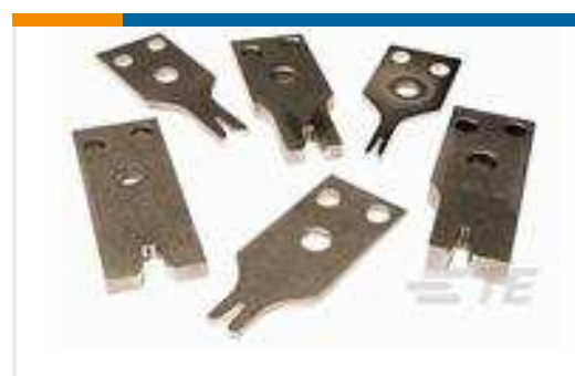
TE Teilenummer1-1633860-9 CRIMPER, WIRE F