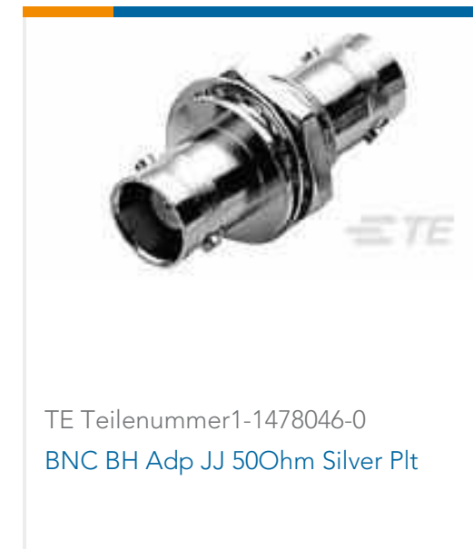
TE Teilenummer1-1478046-0 BNC BH Adp JJ 50Ohm Silver Plt