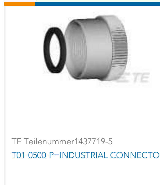
TE Teilenummer1437719-5 T01-0500-P=INDUSTRIAL CONNECTO