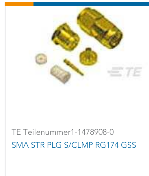
TE Teilenummer1-1478908-0 SMA STR PLG S/CLMP RG174 GSS