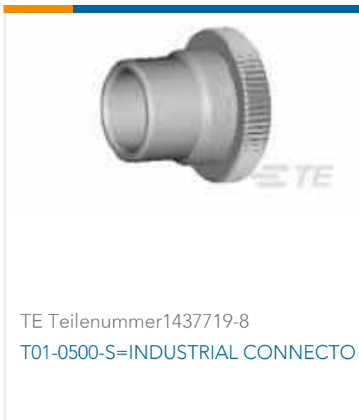
TE Teilenummer1437719-8 T01-0500-S=INDUSTRIAL CONNECTO