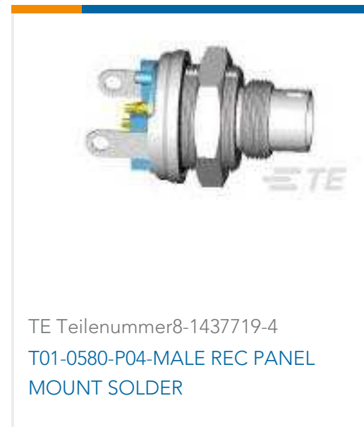
TE Teilenummer8-1437719-4 T01-0580-P04-MALE REC PANEL MOUNT SOLDER