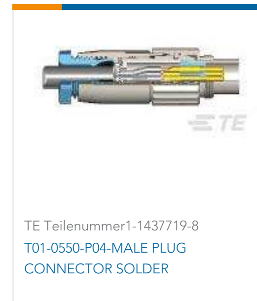
TE Teilenummer1-1437719-8 T01-0550-P04-MALE PLUG CONNECTOR SOLDER