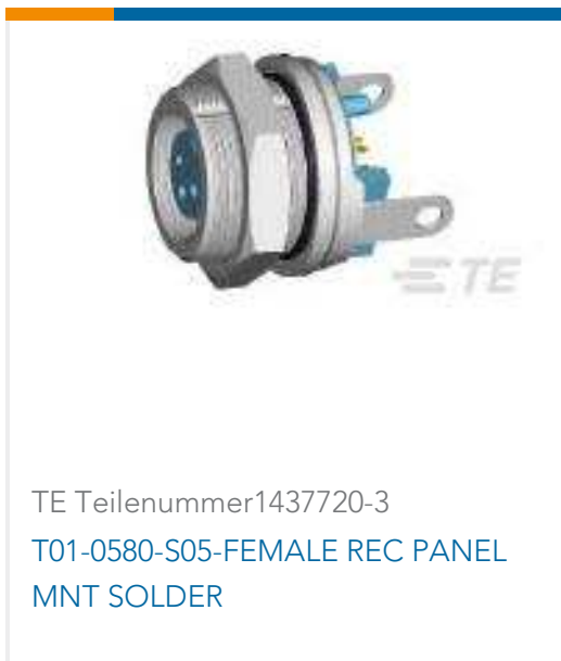
TE Teilenummer1437720-3 T01-0580-S05-FEMALE REC PANEL MNT SOLDER