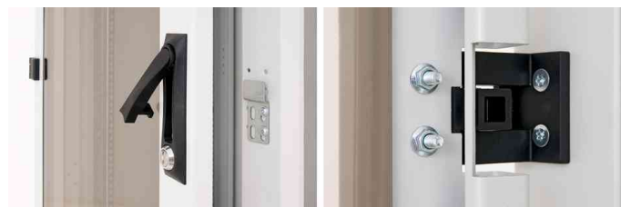
Schwenkhebelgriff - flexible Türöffnung