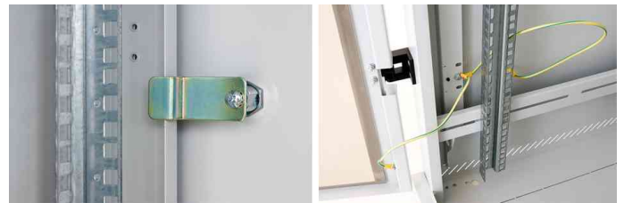
Befestigungsteil und Schlossteil der anhebbaren Rückwand