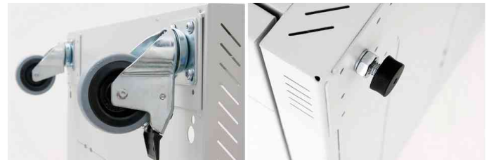
Montagemöglichkeit für Rollen oder Nivellierfüße