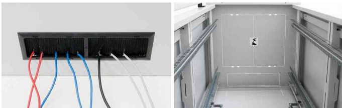
Herausbrechbare Verblendungen - Öffnung für die Belüftungseinheit