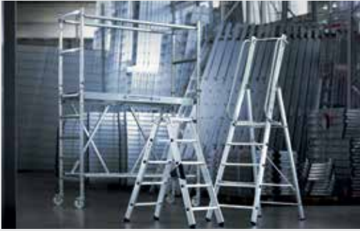
MUNK Günstzburger Steigtechnik

Die MUNK Günstzburger Steigtechnik ist eine Marke der MUNK Group und steht für Leitern, Rollgerüste und Sonderkonstruktionen in Premium-Qualität.