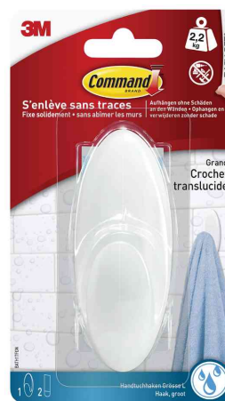
Crochet pour salle de bain, taille: L