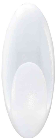
Visuel de référence: Crochet pour salle de bain