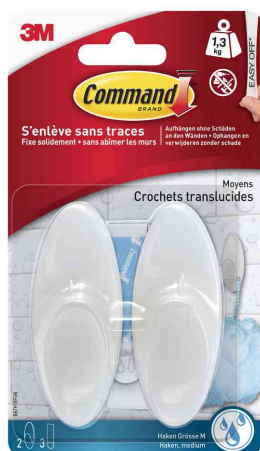
Crochet pour salle de bain, taille: M