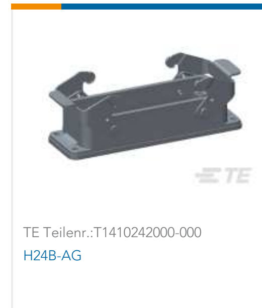
TE Teilnr.:T1410242000-000 H24B-AG