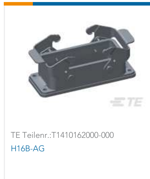
TE Teilnr.:T1410162000-000 H16B-AG