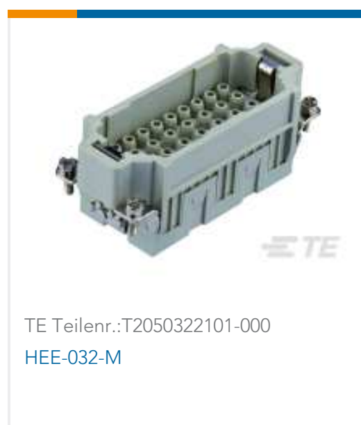
TE Teilnr.:T2050322101-000 HEE-032-M