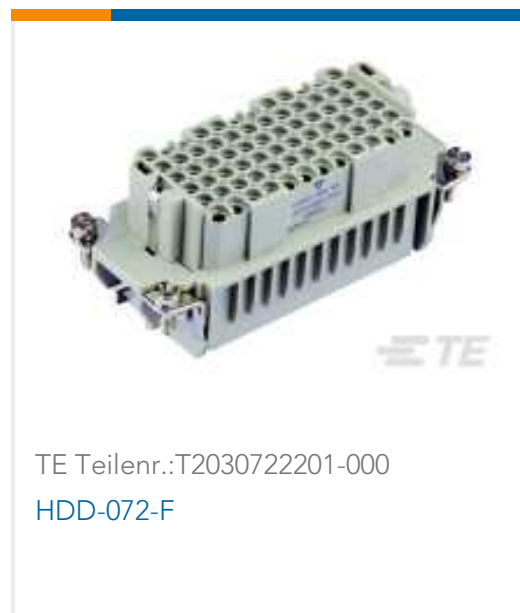
TE Teilnr.:T2030722201-000 HDD-072-F