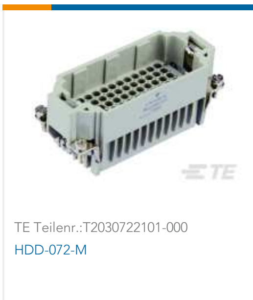
TE Teilnr.:T2030722101-000 HDD-072-M