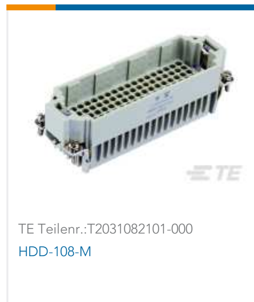
TE Teilnr.:T2031082101-000 HDD-108-M