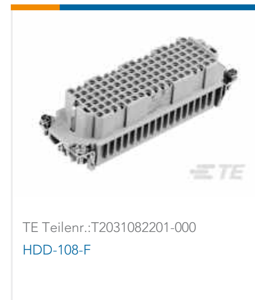
TE Teilnr.:T2031082201-000 HDD-108-F