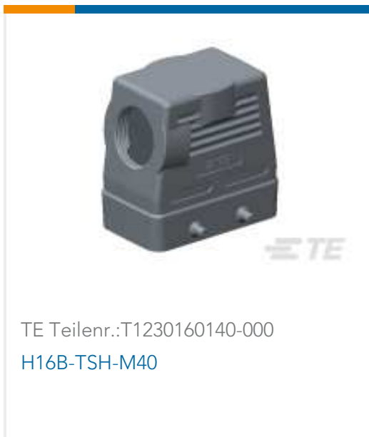
TE Teilnr.:T1230160140-000 H16B-TSH-M40