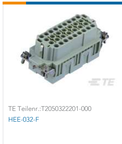
TE Teilnr.:T2050322201-000 HEE-032-F