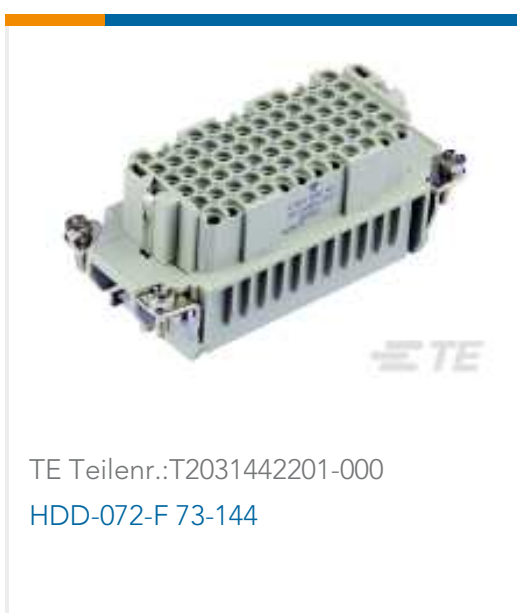
TE Teilnr.:T2031442201-000 HDD-072-F 73-144