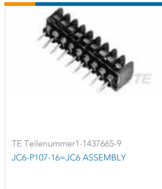
TE Teilenummer1-1437665-9 JC6-P107-16=JC6 ASSEMBLY