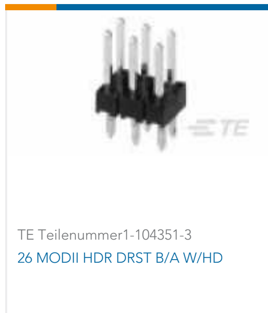
TE Teilenummer1-104351-3 26 MODII HDR DRST B/A W/HD