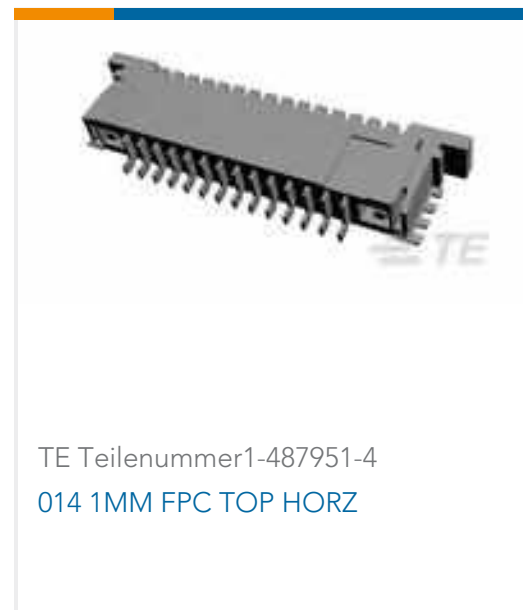
TE Teilenummer1-487951-4 014 1MM FPC TOP HORZ