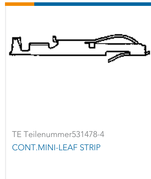
TE Teilenummer531478-4 CONT.MINI-LEAF STRIP