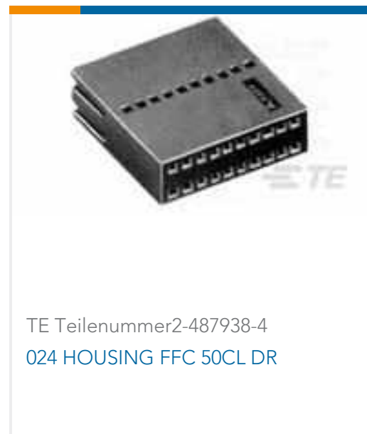
TE Teilenummer2-487938-4 024 HOUSING FFC 50CL DR