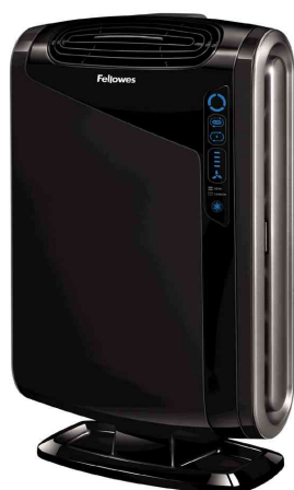
Luftreiniger AeraMax 290