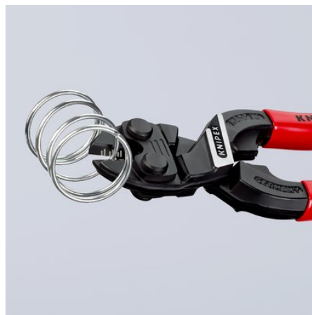
Nagy teljesítményű egészen a hegyekig