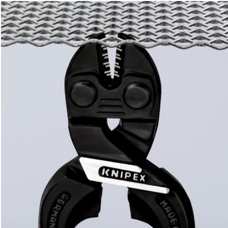
Keskeny fej az optimális hozzáféréshez