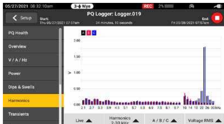
Von den ersten 50 ganzzahligen Oberschwingungen und von 2 kHz bis 30 kHz ist eine vollständige Übersicht der Oberschwingung verfügbar

Die Fluke Serie 1770 ist für den sicheren und einfachen Einsatz in jeder Messumgebung konzipiert. Mit ihr lassen sich eine Vielzahl von Messgrößen der Netzqualität sowie von schnellen Signalen und Transienten sowie Oberschwingungen höherer Frequenzen erfassen, die alle sofort auf dem großen, hochauflösenden Bildschirm sichtbar sind. Mit Sicherheit gemäß den Überspannungskategorien CAT IV 600 V/ CAT III 1000 V können diese Analysatoren an der Einspeisung oder an nachgelagerten Komponenten AC- und DC-Eingänge sowie Oberschwingungen bis zu 30 kHz messen. Mit der Serie 1770 können Sie sicher sein, die nötigen Daten zu erfassen, mit denen Sie unabhängig von der Aufgabe bessere Entscheidungen zur Instandhaltung treffen können.