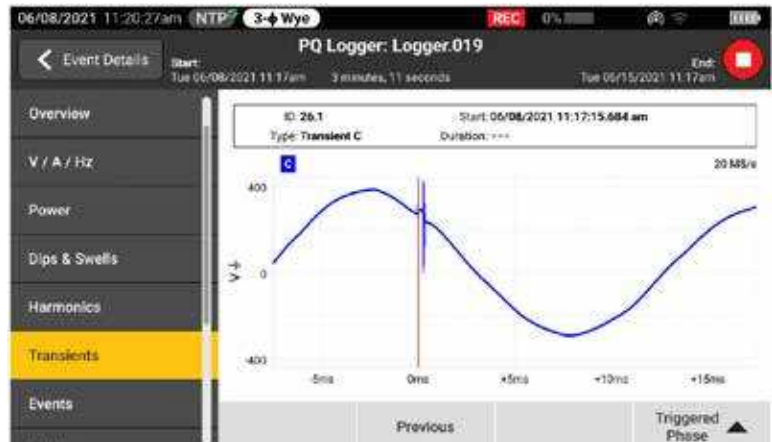
Schnellere Problembeseitigung durch Anzeige von Transienten in Echtzeit, während die Protokollierung noch läuft

Transienten wirken sich tagtäglich negativ auf ansonsten einwandfreie Systeme aus und ihr Potenzial zur Schädigung von Anlagen darf nicht unterschätzt werden. Unabhängig davon, ob in Ihrem System Impuls- oder Schwingungstransienten auftreten, können die Ergebnisse verheerend sein und Probleme verursachen, die von beschädigter Isolierung bis hin zu Totalausfällen von Anlagen reichen. Fluke 1775 und Fluke 1777 verfügen über innovative Technologie zur Transientenerfassung, mit der Sie schnelle Spannungstransienten eindeutig erkennen können und über die nötigen Daten verfügen, um ihre Entstehung zu vermeiden. Der Netzqualitätsanalysator Fluke 1775 hat eine Abtastrate von 1 MHz zur Erfassung schneller Transienten, das Modell Fluke 1777 von 20 MHz, um auch die schnellsten Transienten mit hoher Detailgenauigkeit zu erfassen.