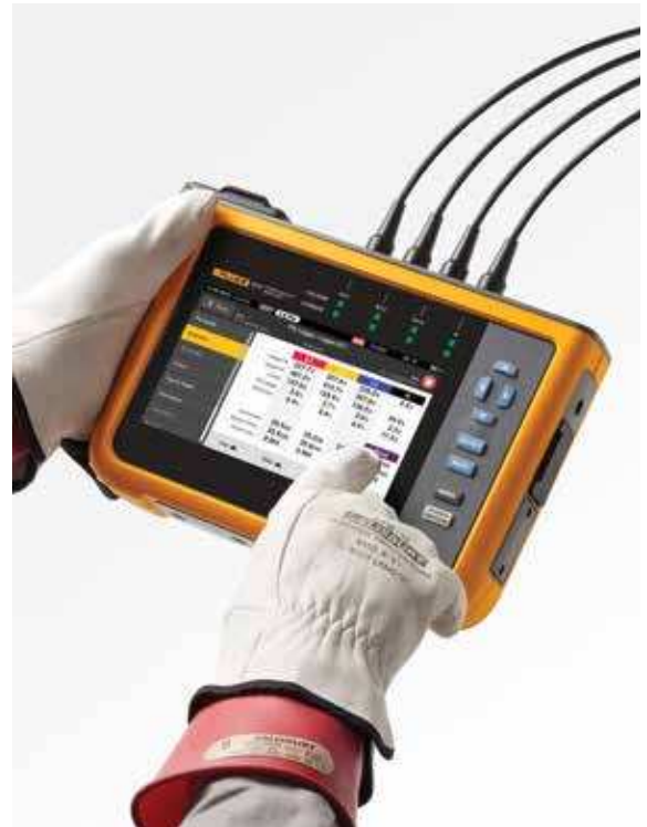
Bequeme Navigation auf dem großen Farb-Touchscreen

Beim Herunterladen von Daten aus den Netzqualitätsanalysatoren der Fluke Serie 1770 kann das mitgelieferte Softwarepaket Energy Analyze Plus statistische Daten zur gemessenen Spannung und zu Stromüberschwingungen mit verschiedenen Normen wie EN 50160 oder IEEE 519 vergleichen und so ermitteln, ob sie die Konformitätsgrenzen überschreiten. Mit dieser leistungsstarken Funktion für die vorausschauende Instandhaltung lassen sich Stromüberschwingungen beobachten, bevor eine Verzerrung der Spannung auftritt. So können Sie unerwartete Fehler oder Konformitätsverstöße verhindern und die Systemverfügbarkeit verbessern. Die Verbreitung von Lasten und Stromversorgungen mit Wechselrichtern macht es immer wichtiger, die Stromüberschwingungen unter Kontrolle zu halten, um eine zuverlässige Netzqualität zu gewährleisten und Systemausfallzeiten zu vermeiden.