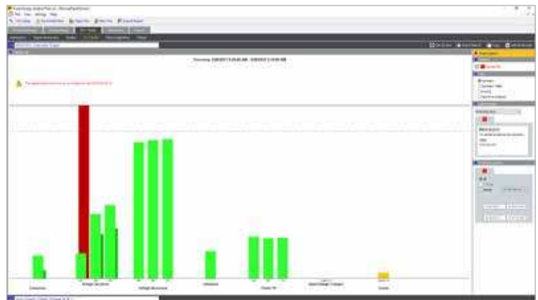
Fluke Energy Analyze Plus: Übersicht über den Zustand der Netzqualität