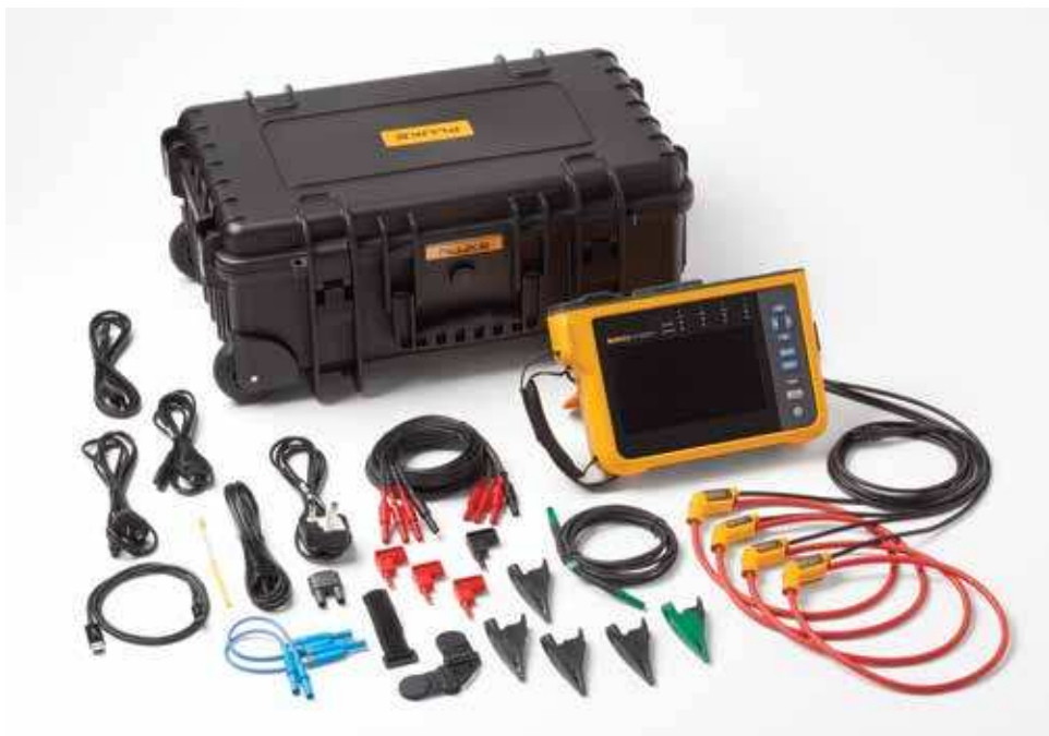
Netzqualitätsanalysator Fluke 1777. Hinweis: Die enthaltenen Artikel variieren je nach Modell und sind in der Tabelle Bestellinformationen aufgeführt.