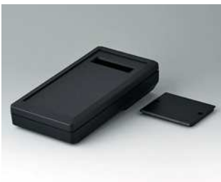
A9074309 DATEC-MOBIL-BOX M, Ausf. III ABS (UL 94 HB) schwarz RAL 9005 195x101x44mm IP 65 opt.