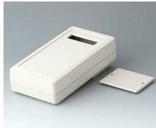
A9074227 DATEC-MOBIL-BOX M, Ausf. II, hoch ABS (UL 94 HB) grauweiß RAL 9002 195x101x59mm IP 65 opt.