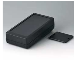
A9074129 DATEC-MOBIL-BOX M, Ausf. I, hoch ABS (UL 94 HB) schwarz RAL 9005 195x101x59mm IP 65 opt.