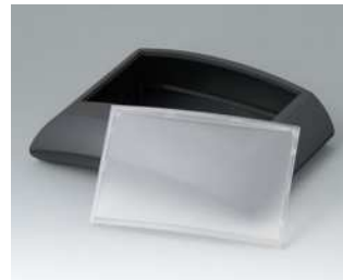
B7020149 ERGO-CASE L, flach ABS (UL 94 HB) schwarz RAL 9005 150x200x54mm IP 40