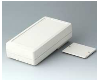
A9074127 DATEC-MOBIL-BOX M, Ausf. I, hoch ABS (UL 94 HB) grauweiß RAL 9002 195x101x59mm IP 65 opt.