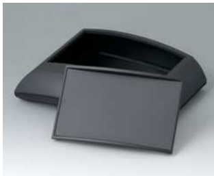
B7020139 ERGO-CASE L, flach ABS (UL 94 HB) schwarz RAL 9005 150x200x54mm IP 40