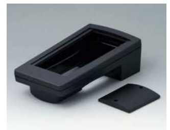
A9046209 HAND-TERMINAL M, Ausf. II PC+ABS (UL 94 V-0) schwarz RAL 9005 220x120x65mm IP 65 opt.