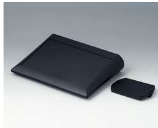
A0620019 COMTEC 200 F, Ausf. II ABS (UL 94 HB) schwarz RAL 9005 200x150x42,8mm IP 40