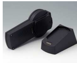
A9077259 SET: DATEC-CONTROL S, Ausf. II, Sockel.. ABS (UL 94 HB) schwarz RAL 9005 228x117mm IP 65 opt.