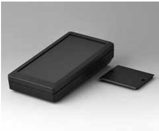
A9074109 DATEC-MOBIL-BOX M, Ausf. I ABS (UL 94 HB) schwarz RAL 9005 195x101x44mm IP 65 opt.