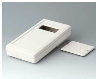
A9074407 DATEC-MOBIL-BOX M, Ausf. IV ABS (UL 94 HB) grauweiß RAL 9002 195x101x44mm IP 65 opt.