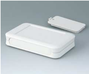
A9052127 SOFT-CASE L ABS (UL 94 HB) grauweiß RAL 9002 73x117x24mm IP 40