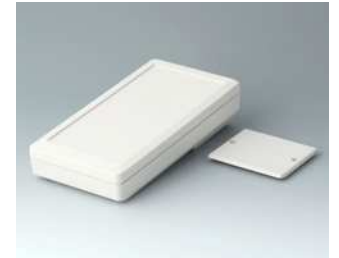
A9074107 DATEC-MOBIL-BOX M, Ausf. I ABS (UL 94 HB) grauweiß RAL 9002 195x101x44mm IP 65 opt.