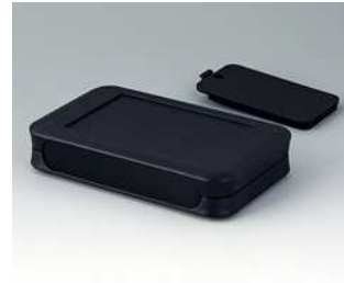
A9052229 SOFT-CASE L PMMA (IR) (UL 94 HB) schwarz RAL 9005 73x117x24mm IP 40