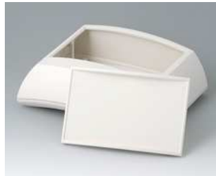
B7025137 ERGO-CASE L, hoch ABS (UL 94 HB) grauweiß RAL 9002 150x200x69mm IP 40