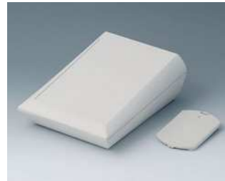
A0615117 COMTEC 150 H, Ausf. II ABS (UL 94 HB) grauweiß RAL 9002 150x200x71,5mm IP 40