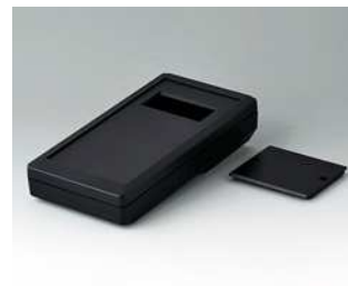
A9074409 DATEC-MOBIL-BOX M, Ausf. IV ABS (UL 94 HB) schwarz RAL 9005 195x101x44mm IP 65 opt.