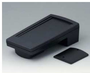
A9046109 HAND-TERMINAL M, Ausf. I PC+ABS (UL 94 V-0) schwarz RAL 9005 220x120x65mm IP 65 opt.