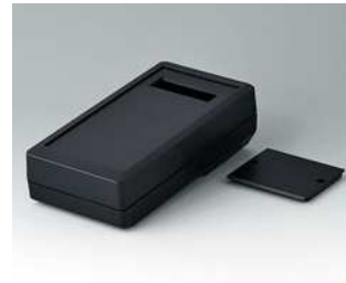
A9074229 DATEC-MOBIL-BOX M, Ausf. II, hoch ABS (UL 94 HB) schwarz RAL 9005 195x101x59mm IP 65 opt.