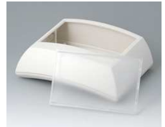
B7025147 ERGO-CASE L, hoch ABS (UL 94 HB) grauweiß RAL 9002 150x200x69mm IP 40