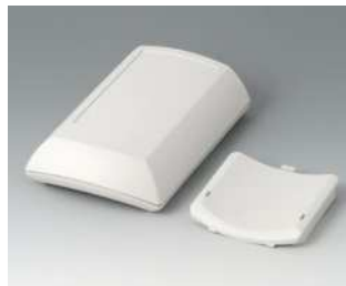
B7010107 ERGO-CASE M, flach ABS (UL 94 HB) grauweiß RAL 9002 150x100x40mm IP 54 opt.