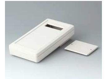
A9074207 DATEC-MOBIL-BOX M, Ausf. II ABS (UL 94 HB) grauweiß RAL 9002 195x101x44mm IP 65 opt.