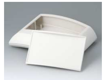
B7020137 ERGO-CASE L, flach ABS (UL 94 HB) grauweiß RAL 9002 150x200x54mm IP 40