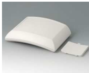
B7020107 ERGO-CASE L, flach ABS (UL 94 HB) grauweiß RAL 9002 150x200x54mm IP 54 opt.