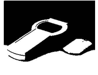
A9077207 DATEC-CONTROL S, Ausf. II ABS (UL 94 HB) grauweiß RAL 9002 228x117x47mm IP 65 opt.