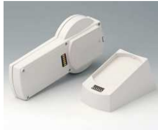
A9077157 SET: DATEC-CONTROL S, Ausf. I, Sockel.. ABS (UL 94 HB) grauweiß RAL 9002 228x117mm IP 65 opt.