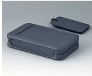
A9052128 SOFT-CASE L ABS (UL 94 HB) lava 73x117x24mm IP 40