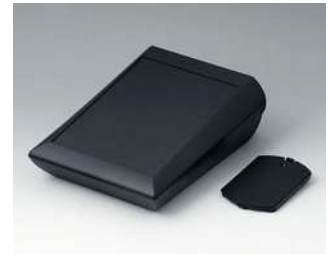
A0615119 COMTEC 150 H, Ausf. II ABS (UL 94 HB) schwarz RAL 9005 150x200x71,5mm IP 40