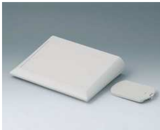
A0620017 COMTEC 200 F, Ausf. II ABS (UL 94 HB) grauweiß RAL 9002 200x150x42,8mm IP 40