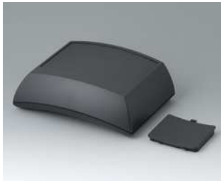
B7025109 ERGO-CASE L, hoch ABS (UL 94 HB) schwarz RAL 9005 150x200x69mm IP 54 opt.