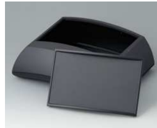
B7025139 ERGO-CASE L, hoch ABS (UL 94 HB) schwarz RAL 9005 150x200x69mm IP 40