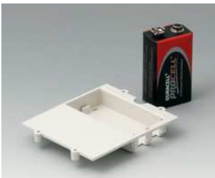
A9177310 Batteriefach, 1 x 9 V ABS (UL 94 HB)