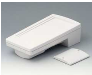
A9046107 HAND-TERMINAL M, Ausf. I PC+ABS (UL 94 V-0) grauweiß RAL 9002 220x120x65mm IP 65 opt.