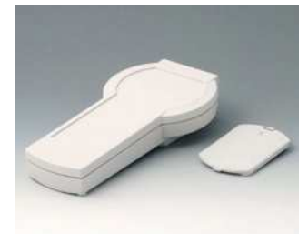
A9077107 DATEC-CONTROL S, Ausf. I ABS (UL 94 HB) grauweiß RAL 9002 228x117x47mm IP 65 opt.