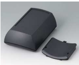
B7015109 ERGO-CASE M, hoch ABS (UL 94 HB) schwarz RAL 9005 150x100x55mm IP 54 opt.