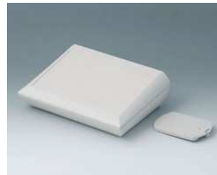
A0620117 COMTEC 200 H, Ausf. II ABS (UL 94 HB) grauweiß RAL 9002 200x150x62,8mm IP 40