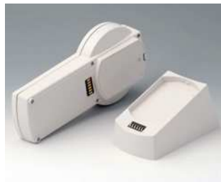
A9077257 SET: DATEC-CONTROL S, Ausf. II, Sockel.. ABS (UL 94 HB) grauweiß RAL 9002 228x117mm IP 65 opt.