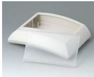
B7020147 ERGO-CASE L, flach ABS (UL 94 HB) grauweiß RAL 9002 150x200x54mm IP 40