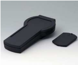
A9077109 DATEC-CONTROL S, Ausf. I ABS (UL 94 HB) schwarz RAL 9005 228x117x47mm IP 65 opt.