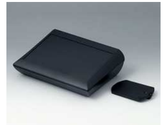
A0620119 COMTEC 200 H, Ausf. II ABS (UL 94 HB) schwarz RAL 9005 200x150x62,8mm IP 40