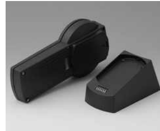
A9077159 SET: DATEC-CONTROL S, Ausf. I, Sockel.. ABS (UL 94 HB) schwarz RAL 9005 228x117mm IP 65 opt.