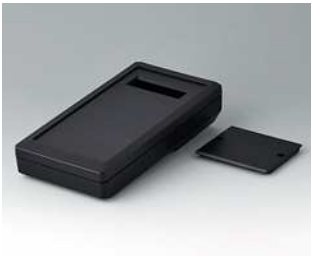
A9074209 DATEC-MOBIL-BOX M, Ausf. II ABS (UL 94 HB) schwarz RAL 9005 195x101x44mm IP 65 opt.