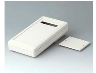
A9074307 DATEC-MOBIL-BOX M, Ausf. III ABS (UL 94 HB) grauweiß RAL 9002 195x101x44mm IP 65 opt.