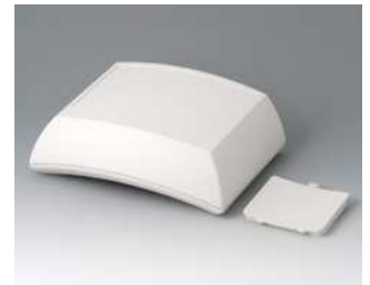
B7025107 ERGO-CASE L, hoch ABS (UL 94 HB) grauweiß RAL 9002 150x200x69mm IP 54 opt.