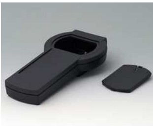
A9077209 DATEC-CONTROL S, Ausf. II ABS (UL 94 HB) schwarz RAL 9005 228x117x47mm IP 65 opt.