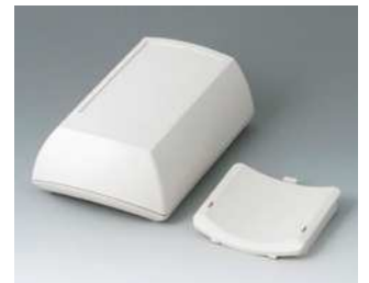
B7015107 ERGO-CASE M, hoch ABS (UL 94 HB) grauweiß RAL 9002 150x100x55mm IP 54 opt.