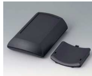
B7010109 ERGO-CASE M, flach ABS (UL 94 HB) schwarz RAL 9005 150x100x40mm IP 54 opt.