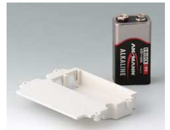
A9174003 Batteriefach, 1 x 9 V ABS (UL 94 HB) grauweiß RAL 9002