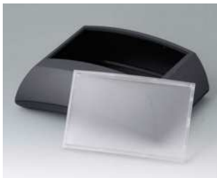
B7025149 ERGO-CASE L, hoch ABS (UL 94 HB) schwarz RAL 9005 150x200x69mm IP 40

Technische Änderungen vorbehalten. © OKW Gehäusesysteme, Buchen/Deutschland.