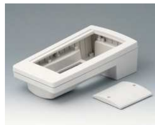
A9046207 HAND-TERMINAL M, Ausf. II PC+ABS (UL 94 V-0) grauweiß RAL 9002 220x120x65mm IP 65 opt.