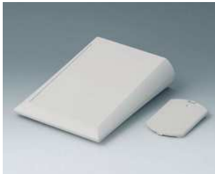
A0615017 COMTEC 150 F, Ausf. II ABS (UL 94 HB) grauweiß RAL 9002 150x200x51,5mm IP 40