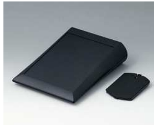
A0615019 COMTEC 150 F, Ausf. II ABS (UL 94 HB) schwarz RAL 9005 150x200x51,5mm IP 40