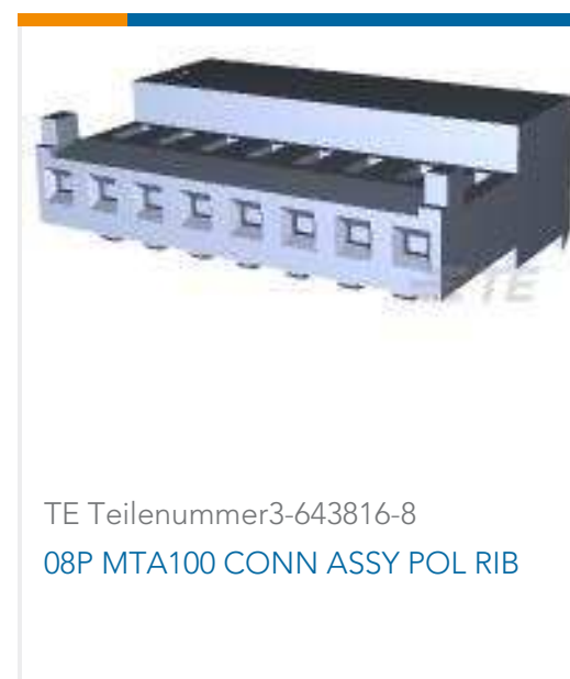
TE Teilenummer 3-643816-8 08P MTA100 CONN ASSY POL RIB