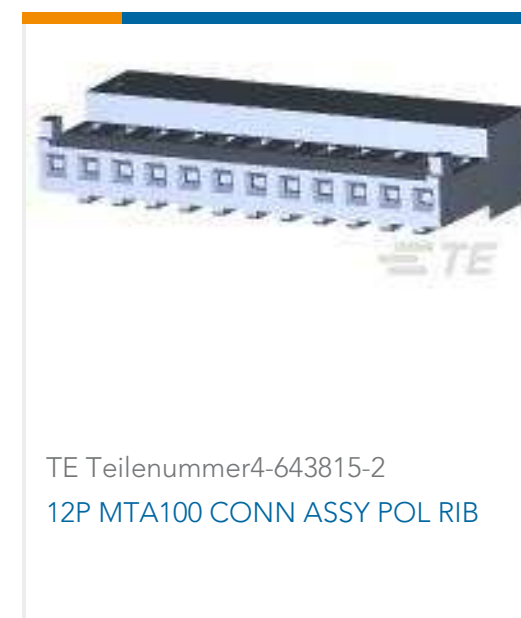
TE Teilenummer 4-643815-2 12P MTA100 CONN ASSY POL RIB