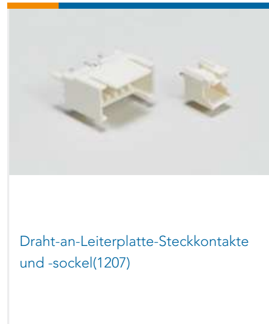
Draht-an-Leiterplatte-Steckkontakte und -sockel(1207)