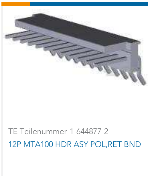
TE Teilenummer 1-644877-2 12P MTA100 HDR ASY POL,RET BND