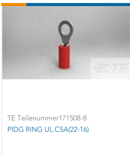
TE Teilenummer 171508-8 PIDG RING UL.CSA(22-16)