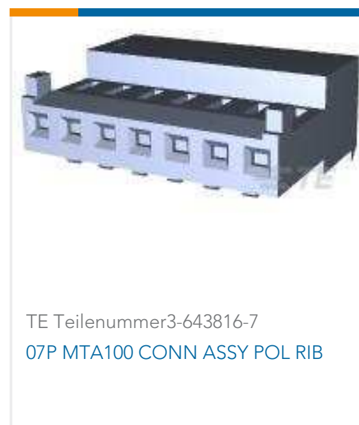
TE Teilenummer 3-643816-7 07P MTA100 CONN ASSY POL RIB