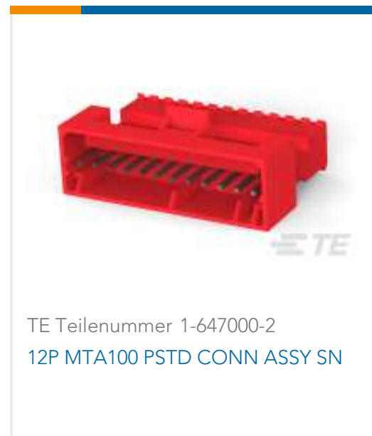
TE Teilenummer 1-647000-2 12P MTA100 PSTD CONN ASSY SN