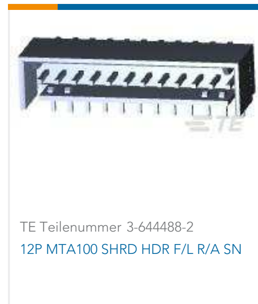
TE Teilenummer 3-644488-2 12P MTA100 SHRD HDR F/L R/A SN