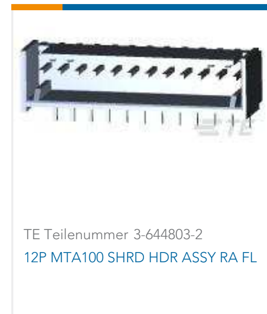
TE Teilenummer 3-644803-2 12P MTA100 SHRD HDR ASSY RA FL