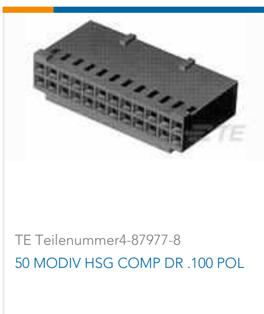
TE Teilenummer 4-87977-8 50 MODIV HSG COMP DR .100 POL