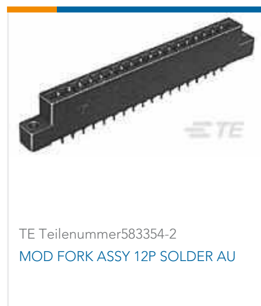
TE Teilenummer 583354-2 MOD FORK ASSY 12P SOLDER AU