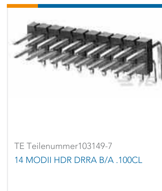
TE Teilenummer 103149-7 14 MODII HDR DRRA B/A .100CL