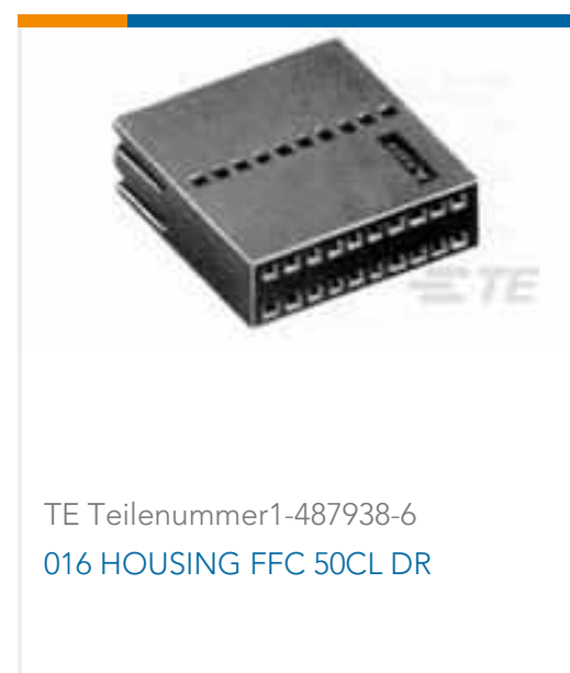
TE Teilenummer 1-487938-6 016 HOUSING FFC 50CL DR