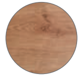
08 Roble · Oak Eiche · Chêne