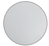
02 Gris · Grey Grau · Gris