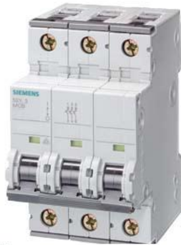
LEITUNGSSCHUTZSCHALTER 400V 10KA, 3POLIG, A, 4A, T=70MM