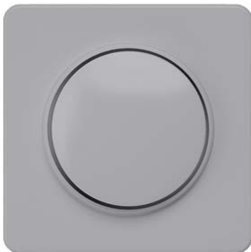
DELTA PROFIL, SILBER ABDECKPLATTE FUER DIMMER MIT DREHKNOPF 65X65MM