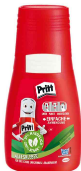
Colle multi-usage, 50 g