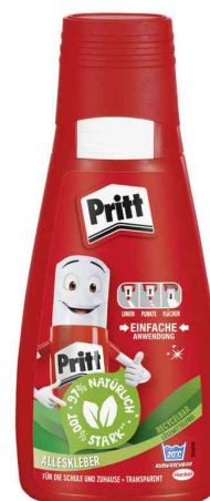
Colle multi-usage, 100 g