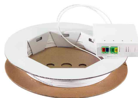
Visuel de référence : boîte d'épissure FTTH avec câble de pose, 2x LCD / APC