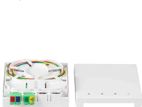
Visuel de référence : boîte d'épissure FTTH avec câble de pose, 2x LCD / APC