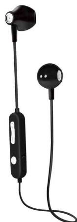
Bluetooth 5.0 In-Ear Kopfhörer