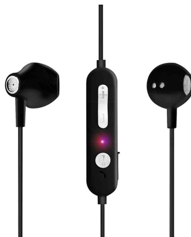
Bluetooth 5.0 In-Ear Kopfhörer