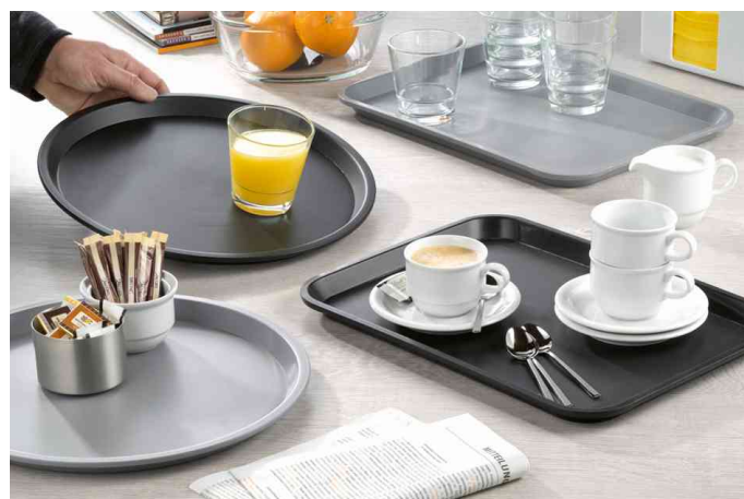
Visuel de référence : montre le produit en utilisation