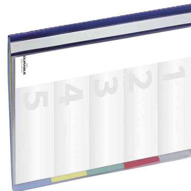
Dossier d'organisation DIVISOFLEX, fermé