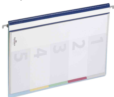
Avec une gouttière pour la tringle de suspension