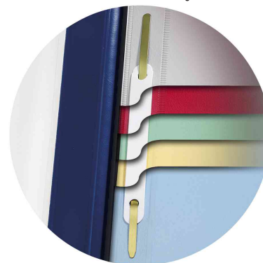
Avec 5 intercalaires et un système d'attache