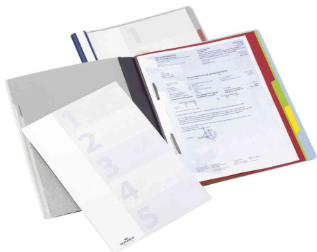
Dossier d'organisation DIVISOFLEX