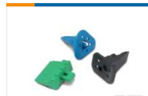
TE Teilnr.:W2S DEUTSCH DT Keilschlösser