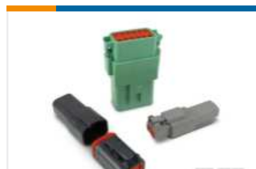
TE Teilnr.:DT04-2P DEUTSCH DT Serie Gehäuse und Steckverbinder