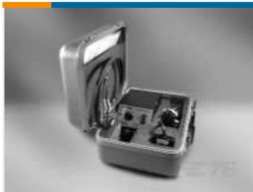
TE Teilnr.: 173643-000 RH-3960-1-TINEL-KIT-120V