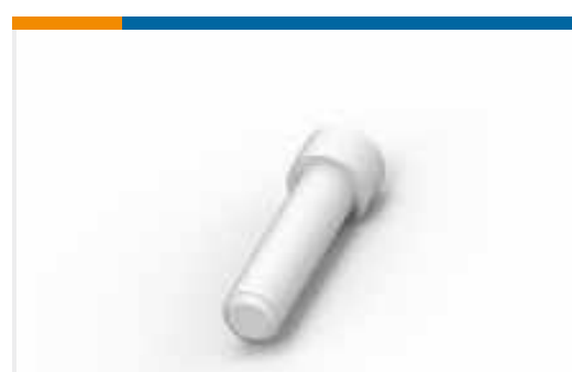
TE Teilnr.:114017-ZZ SEALING PLUG, SIZE 12/16, WHT