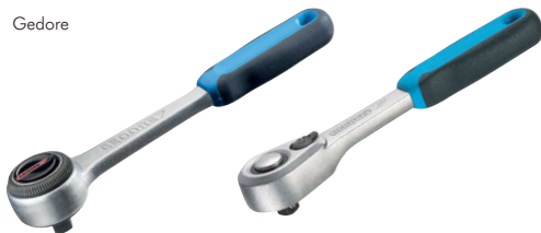
Typ ... K1 G