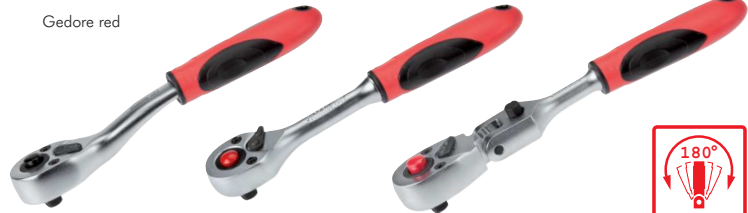
Typ ... K1 C