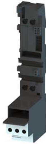
TERMINALMODUL FUER ET 200S DS FUER DIREKTSTARTER OHNE ZULEITUNGSANSCHLUSS