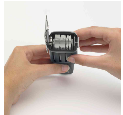
3. Datum einstellen