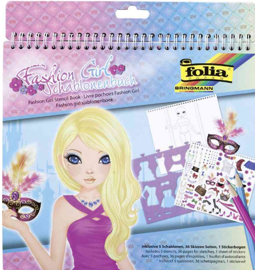
Schablonenbuch "Fashion Girl"

ACHTUNG! Nicht geeignet für Kinder unter 36 Monaten, wegen verschluckbarer Kleinteile.