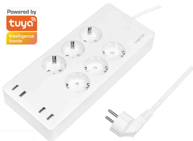
Wi-Fi Smart Steckdosenleiste, 6-fach + 4x USB