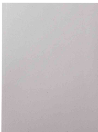
Zeichnungsmappe - Graupappe