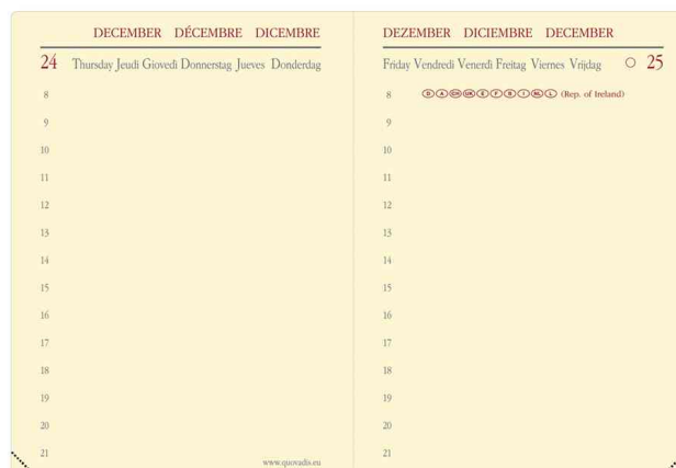
Agenda de poche "MINIDAY ML" - grille