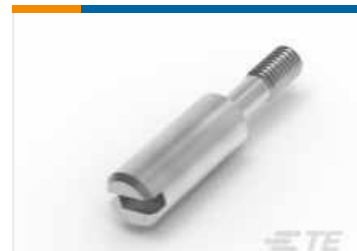
TE Teilnr.:T0931003003-000 CODING-PIN-M3