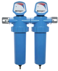
Anwendungsbeispiel: 2 Gehäuse