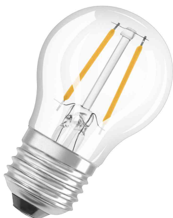
Visuel de référence: Ampoule LED CLASSIC P DIM, culot E27